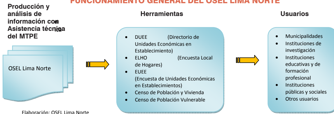
GRÁFICO 1 FUNCIONAMIENTO GENERAL DEL OSEL LIMA NORTE

énfasis en la atención de las necesidades de información de las municipalidades, por lo que se plantea una coordinación estrecha con las mismas. 4 En tal sentido, el OSEL Lima Norte inicia su intervención en los distritos de Comas, Puente Piedra y Ventanilla, luego se extiende a los distritos de Independencia, Los Olivos y San Martín; esta vez con el apoyo